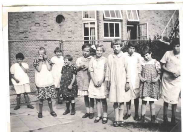
Gefotografeerd in de speeltuin

Dikwijls treffen we idioten aan, die tijden achtereenvolgend gillen en brullen, anderen bijten en scheuren alles kapot (Wieske) smeren met speeksel en urine (K. en W.) zichzelf mutileren. Dikwijls bij idioten automatische en stereotype bewe-