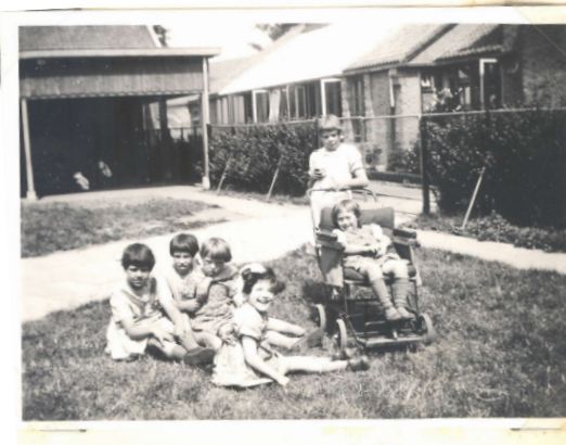
Op deze photo is de achterkant van het "Maria-paviljoen" goed te zien.

verstandelijke vermogens dan naar de leeftijd gekeken werd, werkte Lies in. De kinderen leerden rekenen tot 10, handwerken en wat lezen. De betere meisjes bleven in Huize "Angela" te Den Haag. Opmerkelijk in deze klas was het grote aantal mongolen. De klas van de grote meisjes was erg. Het